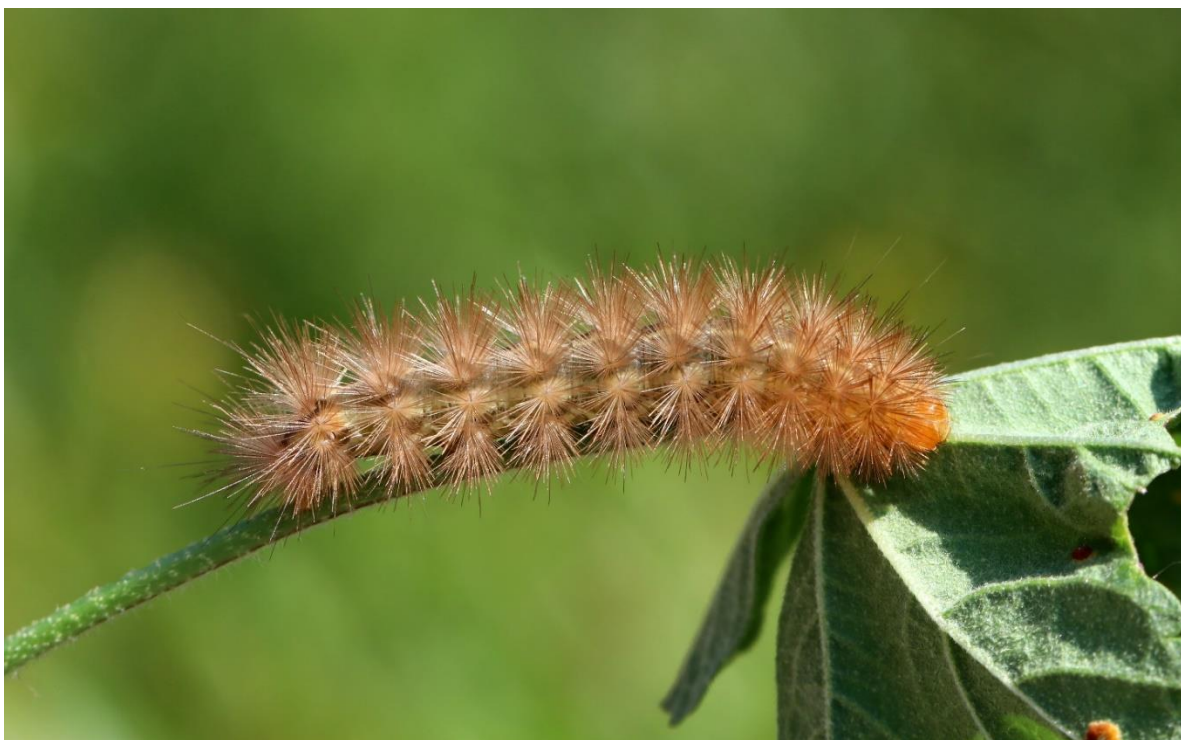
Ecaille mendiante

Sur les bords du parcours, les habitats et la végétation sont naturels et spontanés. Les plantes présentes sont donc adéquates pour le développement et la reproduction des insectes. Lors de l'inventaire nous avons ainsi pu observer des individus adultes de papillons, de sauterelles, de criquets mais également des formes juvéniles et des larves ce qui démontre que les espèces arrivent à réaliser l'ensemble de leur cycle de vie à l'échelle du golf. A titre d'exemple une belle chenille d'Ecaille mendiante (papillons de nuit) a été trouvée au niveau d'une Mauve, sur un talus dont la végétation n'avait pas encore été coupée à proximité du trou n°18.