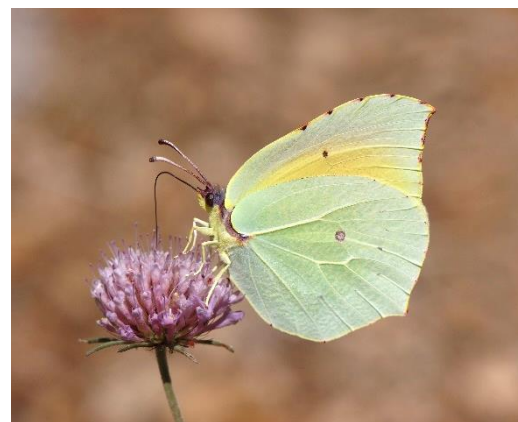
Azuré des nerpruns et Citron de Provence mâle