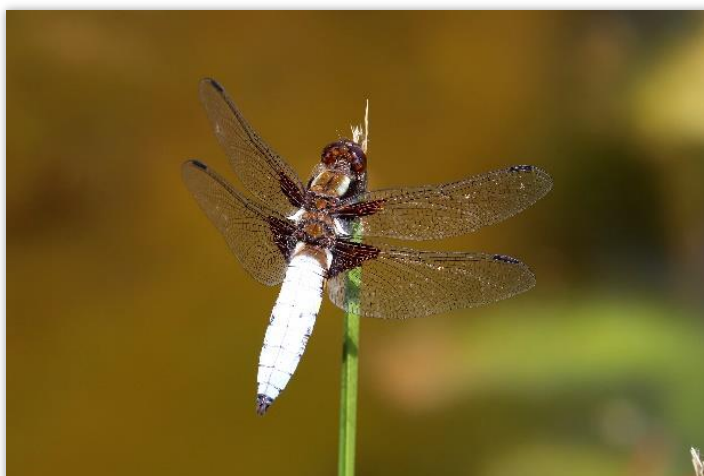
Libellule déprimée

A titre d'exemple, un mâle de libellule déprimée patrouillait à la recherche d'une femelle le long d'un des cours d'eau en compagnie de l'Agrion à stigmas pointus, espèce moins commune répartie uniquement sur le pourtour méditerranéen.